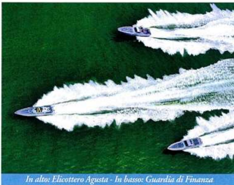
In alto: Elicottero Agusta - In basso: Guardia di Finanza

più diversi. Per il cliente il vantaggio è evidente: progetti pensati su misura e seguiti personalmente da un unico referente, supervisione costante e puntuale di ogni fase e ottimizzazione di tempi e costi. Dai video istituzionali all'advertising classica, tutto deve poter essere ricondotto a un'unica grande visione strategica.